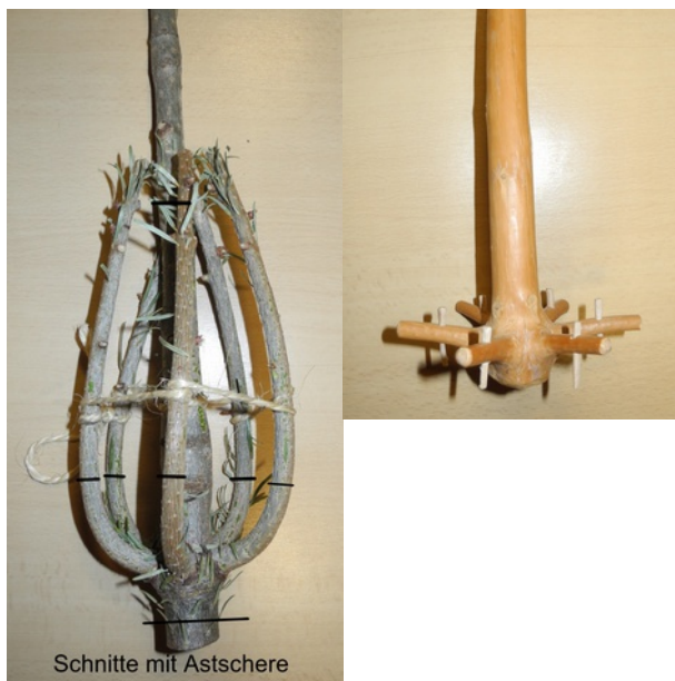
Schnitte mit Astschere