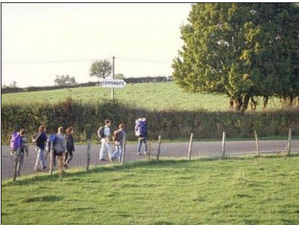
auf dem Weg